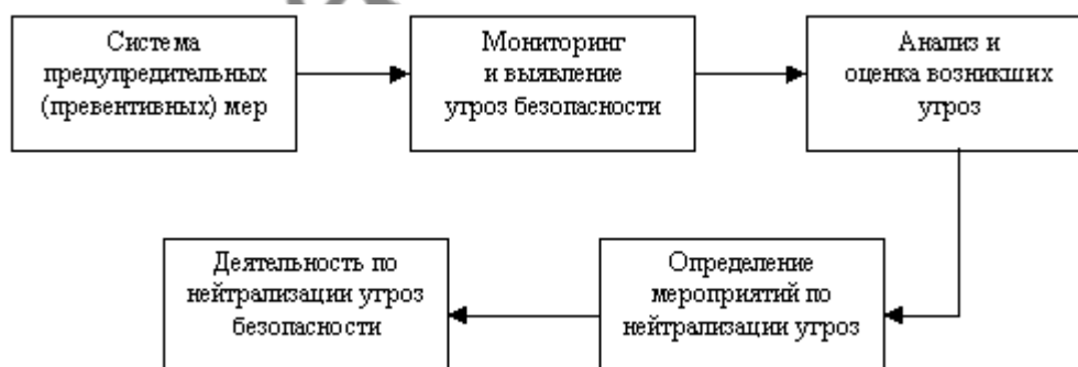
Рис. 2. Общий алгоритм действий, на котором основана работа службы экономической безопасности 4

Практическая деятельность службы экономической безопасности должна основываться на использовании типовых схем, процедур и действий. Прежде всего, следует сказать об общем алгоритме действий, на котором основана работа службы безопасности. Он включает последовательность операций, представленных на рис. 2.